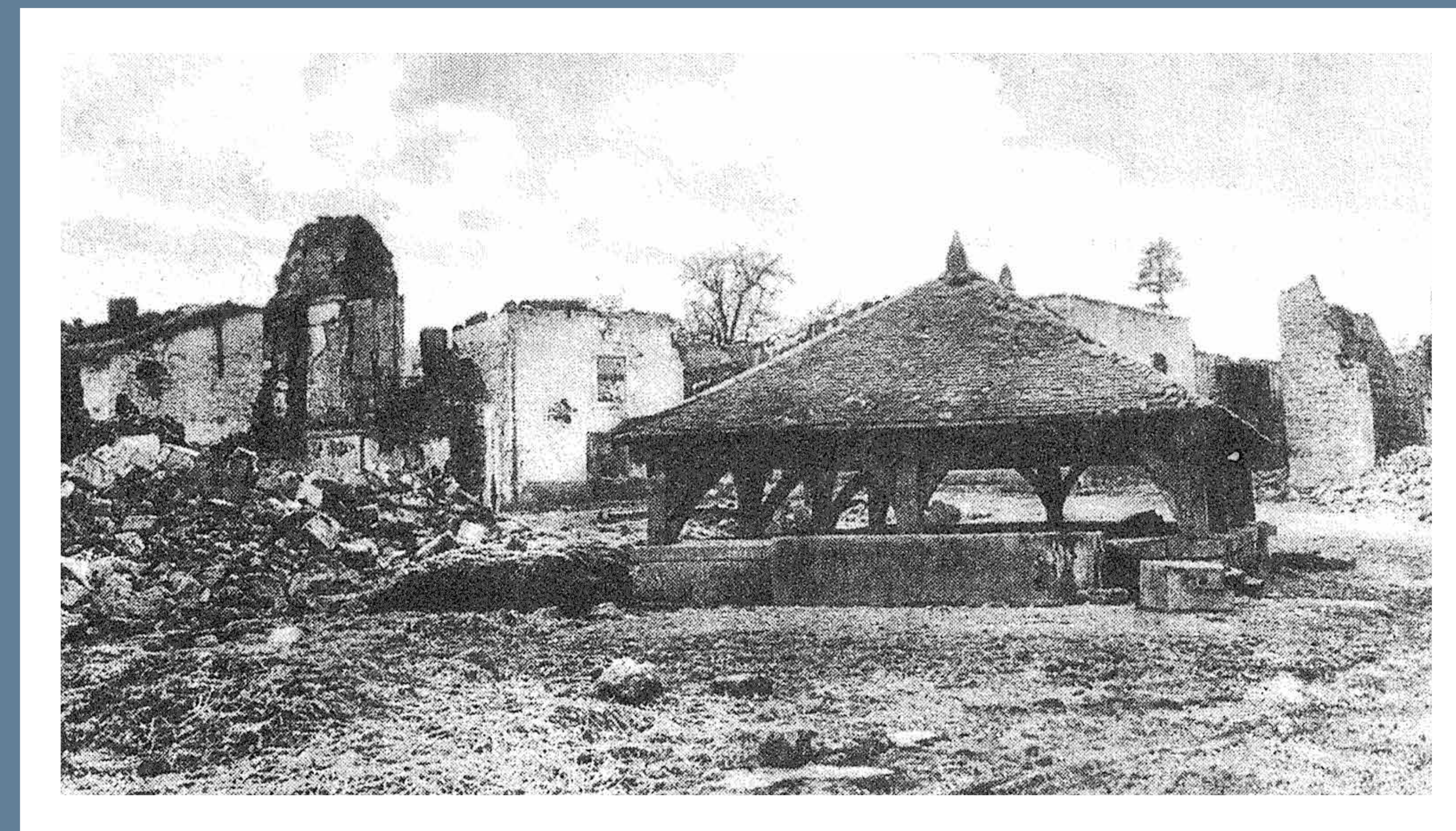
MONTIGNY EN RUINE DAS MONTIGNY IN TRÜMMERN

F – Le soir du 30 août 1914, les compagnies du 117ème régiment d'infanterie traversent Montigny sous les obus. Le lendemain, la bataille s'engage dans le village même laissant de nombreux morts des deux camps sur le terrain. Le village est complètement détruit. 14 civils périssent pendant le combat.