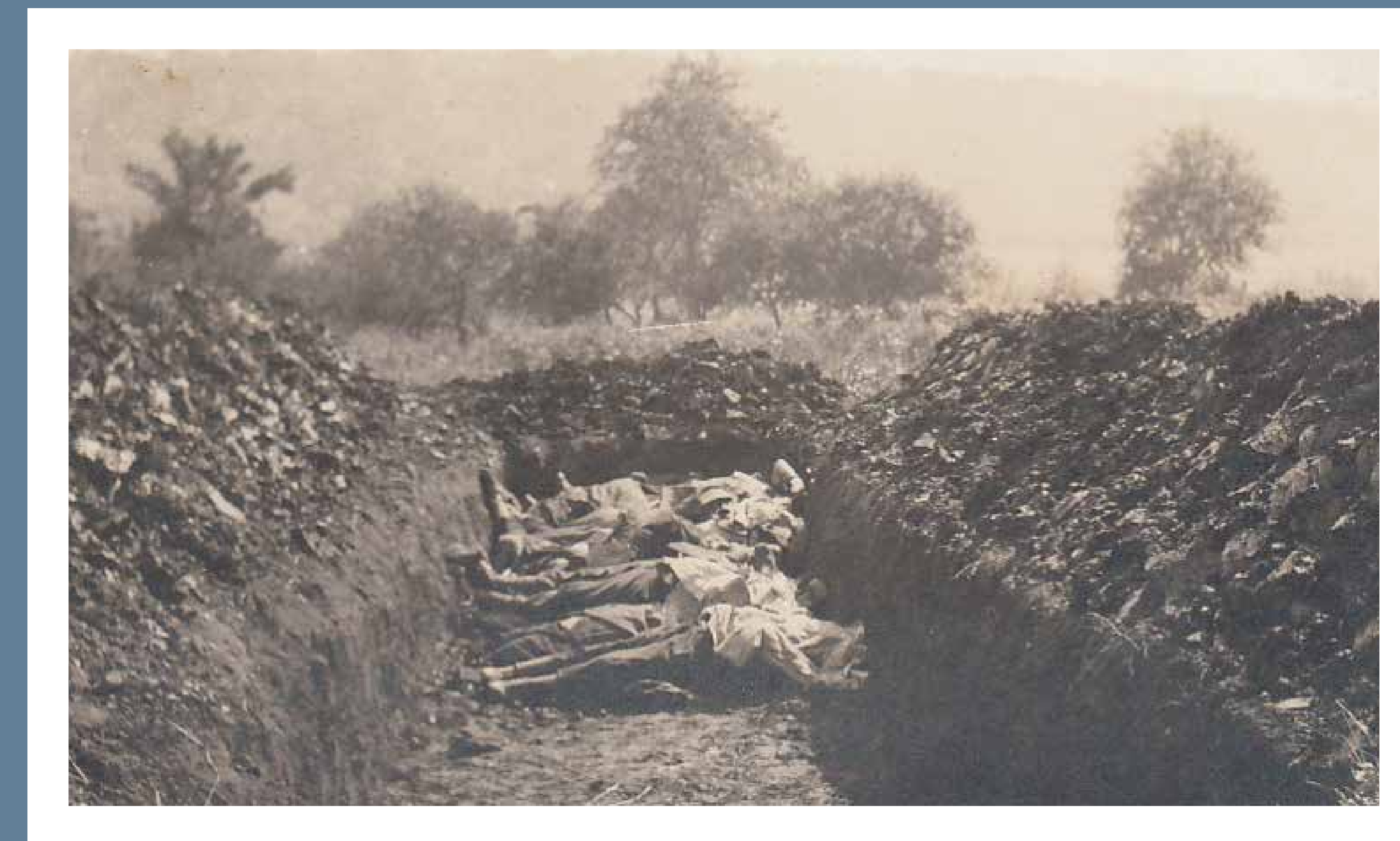
FOSSE COMMUNE MASSENGRAB

NL – Op 30 augustus 1914 trokken de compagnies van het 117de infanterie-regiment 's avonds onder een regen van granaten door Montigny. De dag erna startte het gevecht in het dorp zelf waarbij langs beide kanten veel slachtoffers vielen. Het dorp werd volledig verwoest en er vielen 14 burgerslachtoffers.