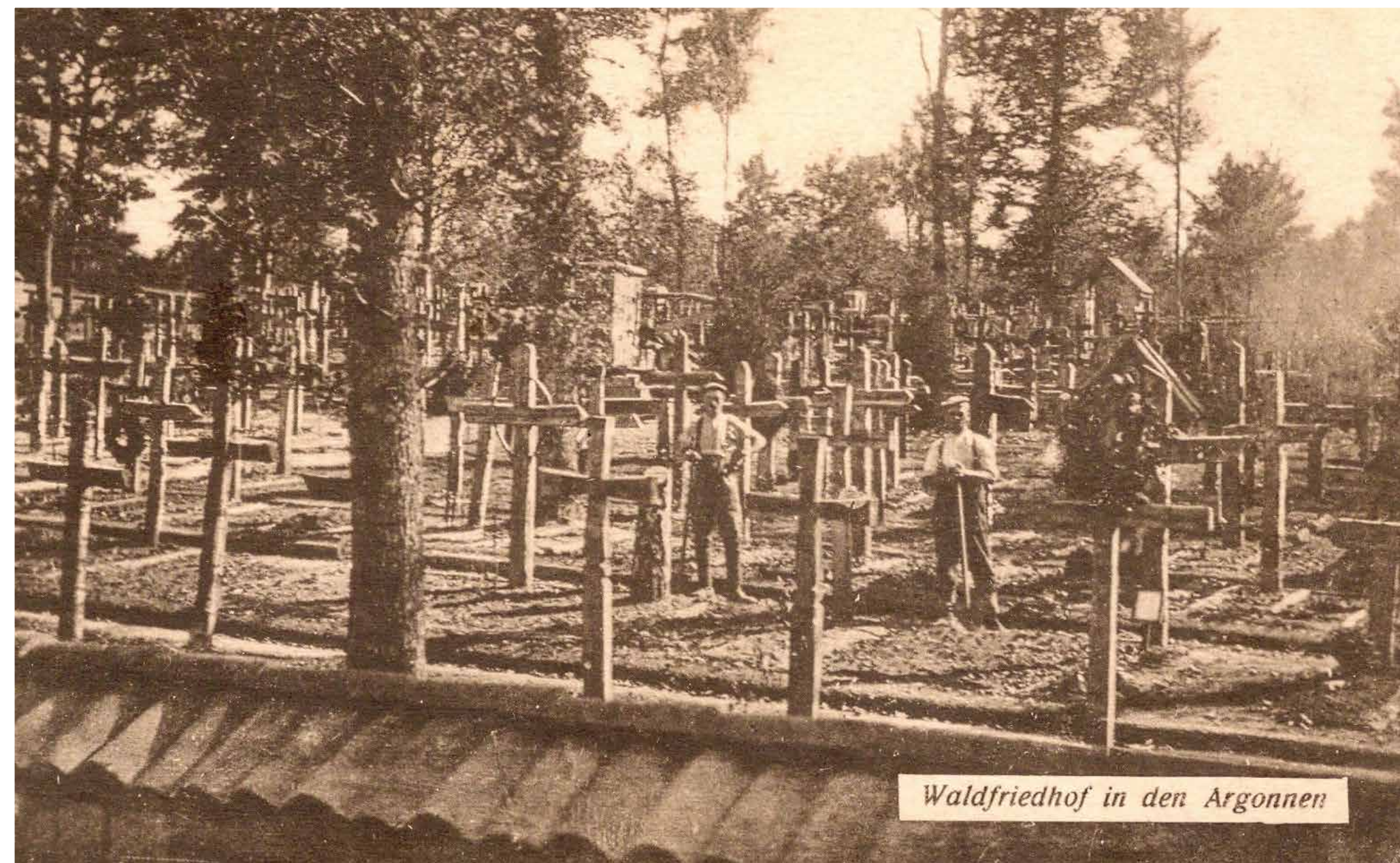
CIMETIERE MILITAIRE SOLDATENFRIEDHOF

Am 31. August schießen die Batterien von Nantillois auf die schweren deutschen Batterien im Umfeld von Liny-devant-Dun; es beginnen heftige Gefechte mit schwerer Artillerie.