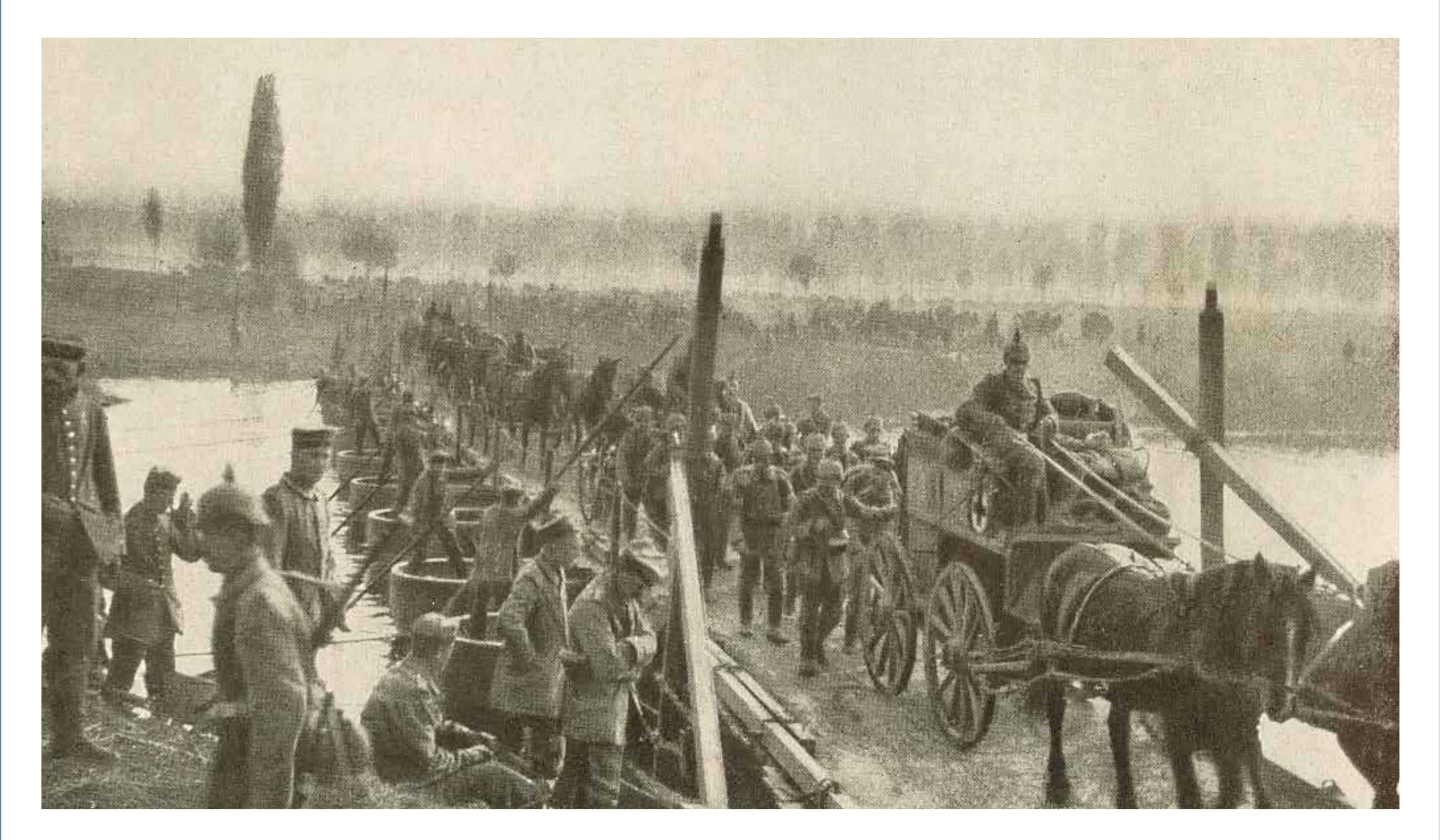
PONT DETRUIT - Collection J. MARIE DAS ZERSTÖRTE BRÜCKE - Sammlung J. MARIE

F – Les secteurs de Dun-sur-Meuse et de Sassey-sur-Meuse sont des lieux de passage importants de troupes françaises vers la Belgique lors de la Bataille des Frontières. Ils voient aussi passer ces troupes en retraite, talonnées par le 13ème corps allemand. La destruction des ponts va gêner considérablement la progression de ce dernier.