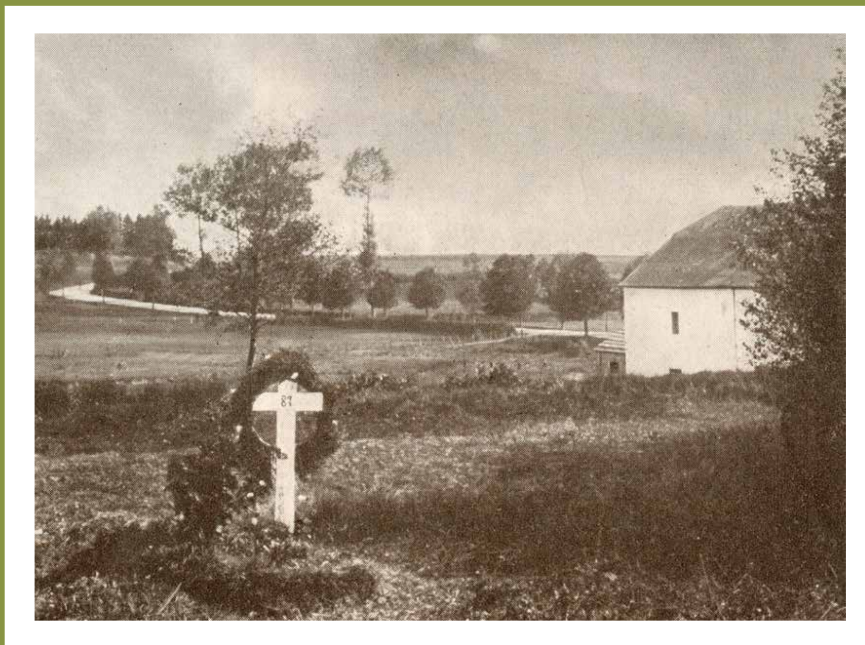
LA CIVANNE – TOMBE PROVISOIRE DERRIERE LE MOULIN LA CIVANNE – BEHELFSMÄSSIGES GRAB HINTER DER MÜHLE

F – Dans le moulin de La Civanne, les Allemands avaient ouvert un «lazaret» (hôpital militaire) et créé un petit cimetière autour du calvaire.