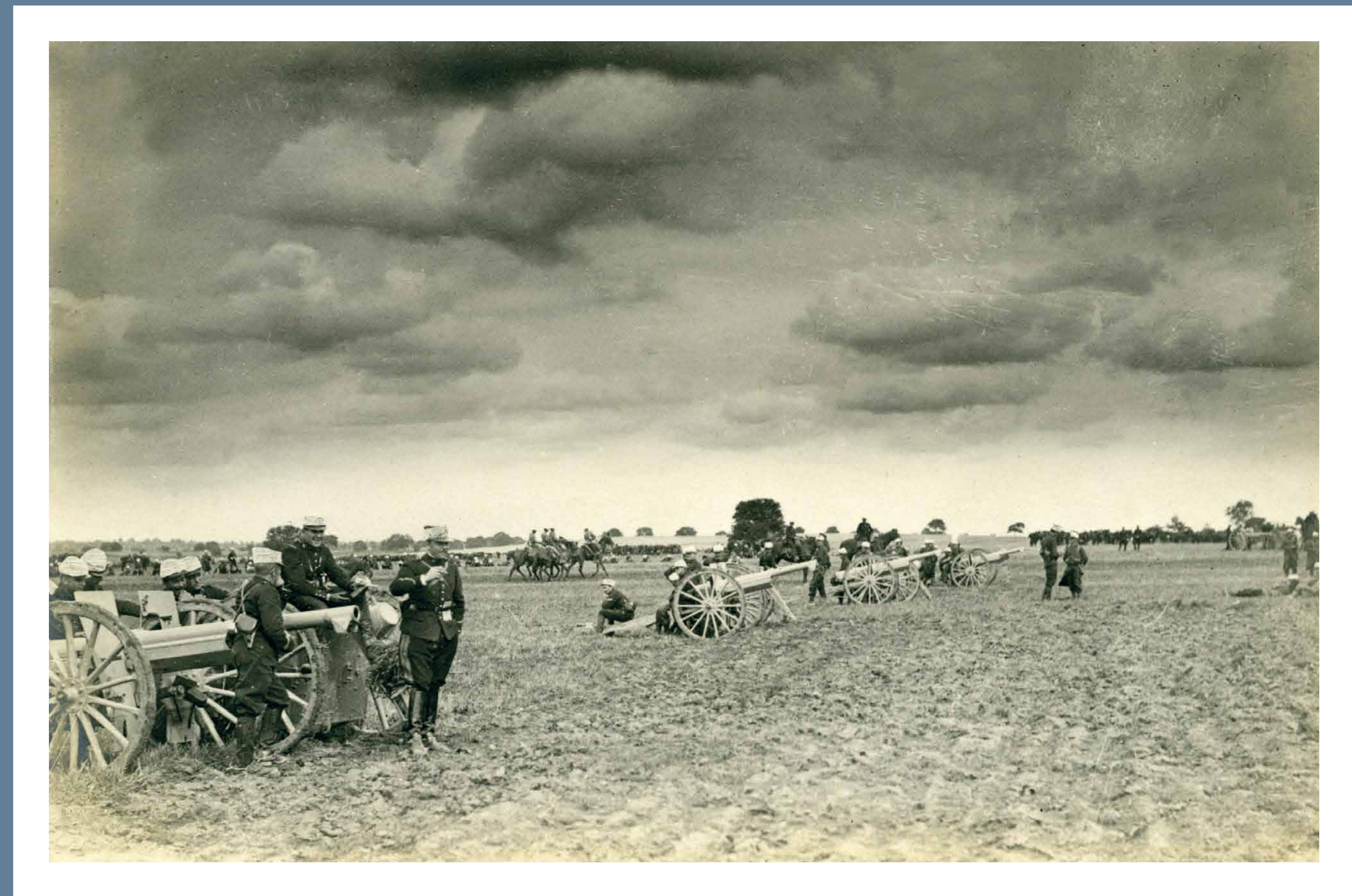
BATTERIE DE 75 EN POSITION 75ER BATTERIE IN STELLUNG

E – According to many historians, 22 August 1914 was probably the bloodiest day in French military history