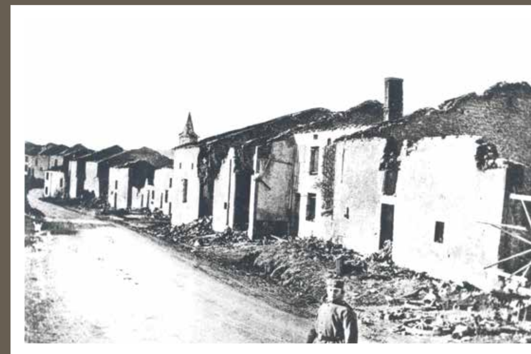
LE VILLAGE DE BEAUCLAIR EN RUINES – SOLDAT ALLEMAND PRESENT SUR LA PHOTO DAS DORF BEAUCLAIR IN TRÜMMERN – AUF DEM PHOTO EIN DEUTSCHER SOLDAT

E – A few units from the French 2nd Army Corps were billeted in Beauclair, which was also a support point for the French forces during the German attack on Cesse and Luzy-Saint-Martin on 27 August 1914. The village also served as a support point for the 13th Infantry Brigade during the French offensive on Beaufort on 31 August.