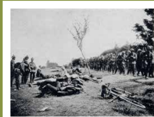
BATAILLE DE BRANDEVILLE SCHLACHT VON BRANDEVILLE