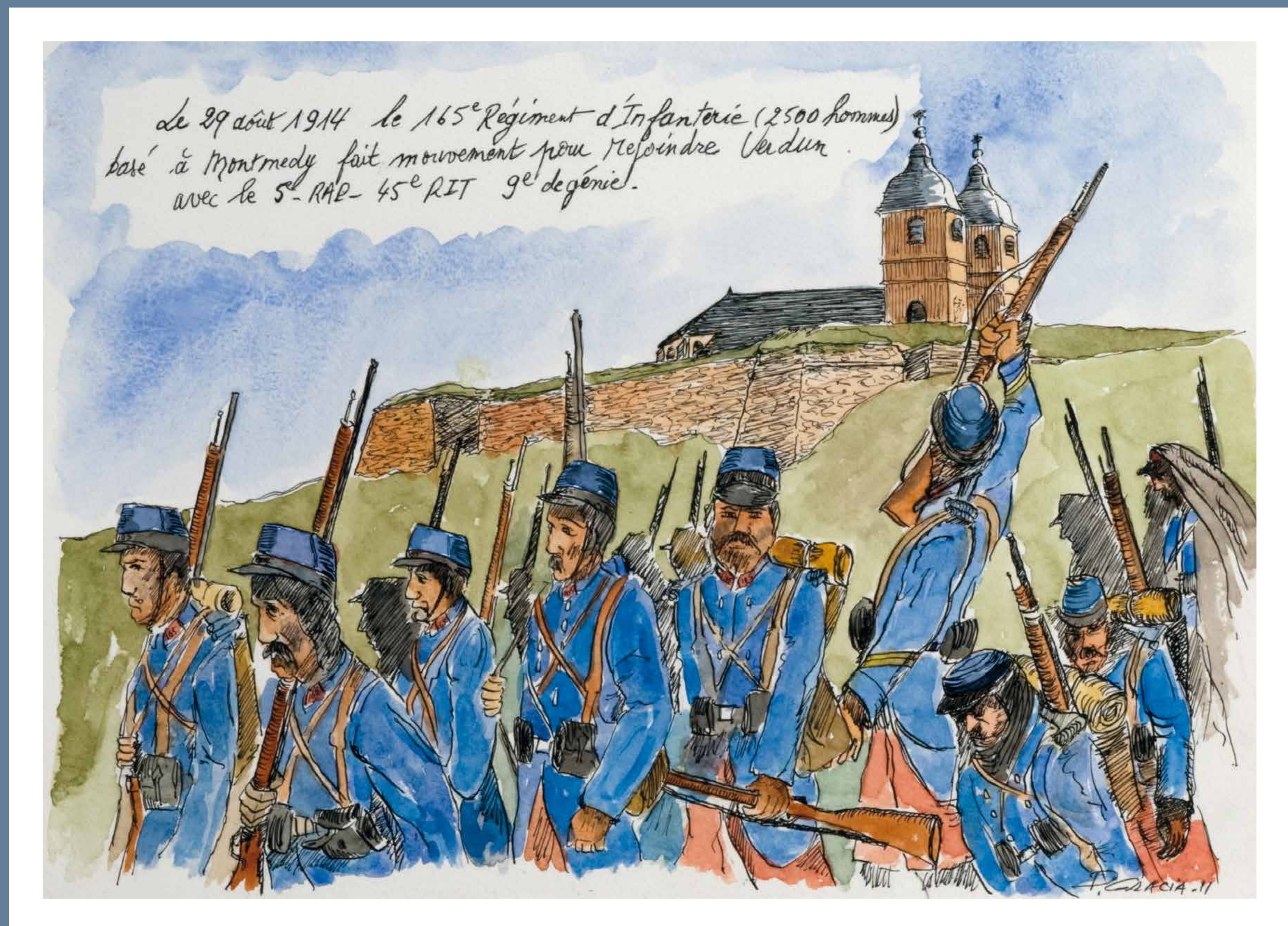
LA GARNISON DE MONTMEDY – Illustration de P. GRACIA GARNISON DE MONTMEDY – Illustration von P. GRACIA

E – After the strategic retreat of the French troops coming from Belgium, the Citadel of Montmédy found itself isolated. On 27 August 1914, the garrison received the order to join the French army at Verdun. It set up a temporary base at Fontaine Saint-Dagobert on 28 August, before facing the enemy in Brandeville on 29 August.