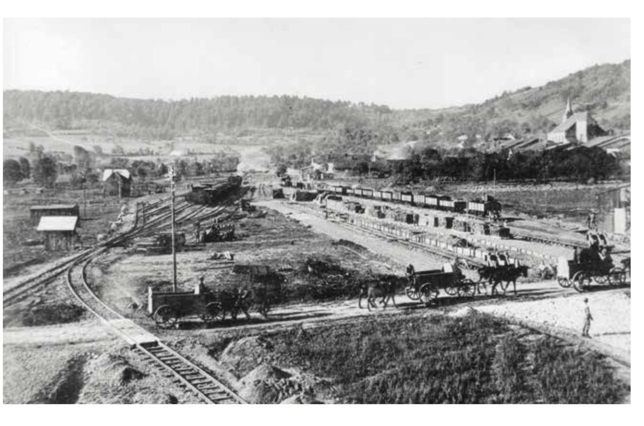
CARE DE BRANDEVILLE BAHNHOF VON BRANDEVILLE