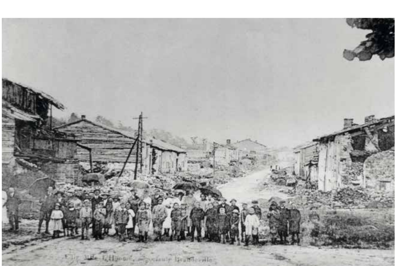
BRANDEVILLE GRANDE RUE APRES 1914 BRANDEVILLE HAUPTSTRASSE NACH 1914

E – On 27 August 1914, 2,300 men from the Montmédy garrison attempted to reach Verdun via the woods. They set up camp at the Fontaine Saint-Dagobert in the forest of Woëvre on 28 August. They fought the enemy at Brandeville on 29 August, where many men lost their lives in a surprise attack.