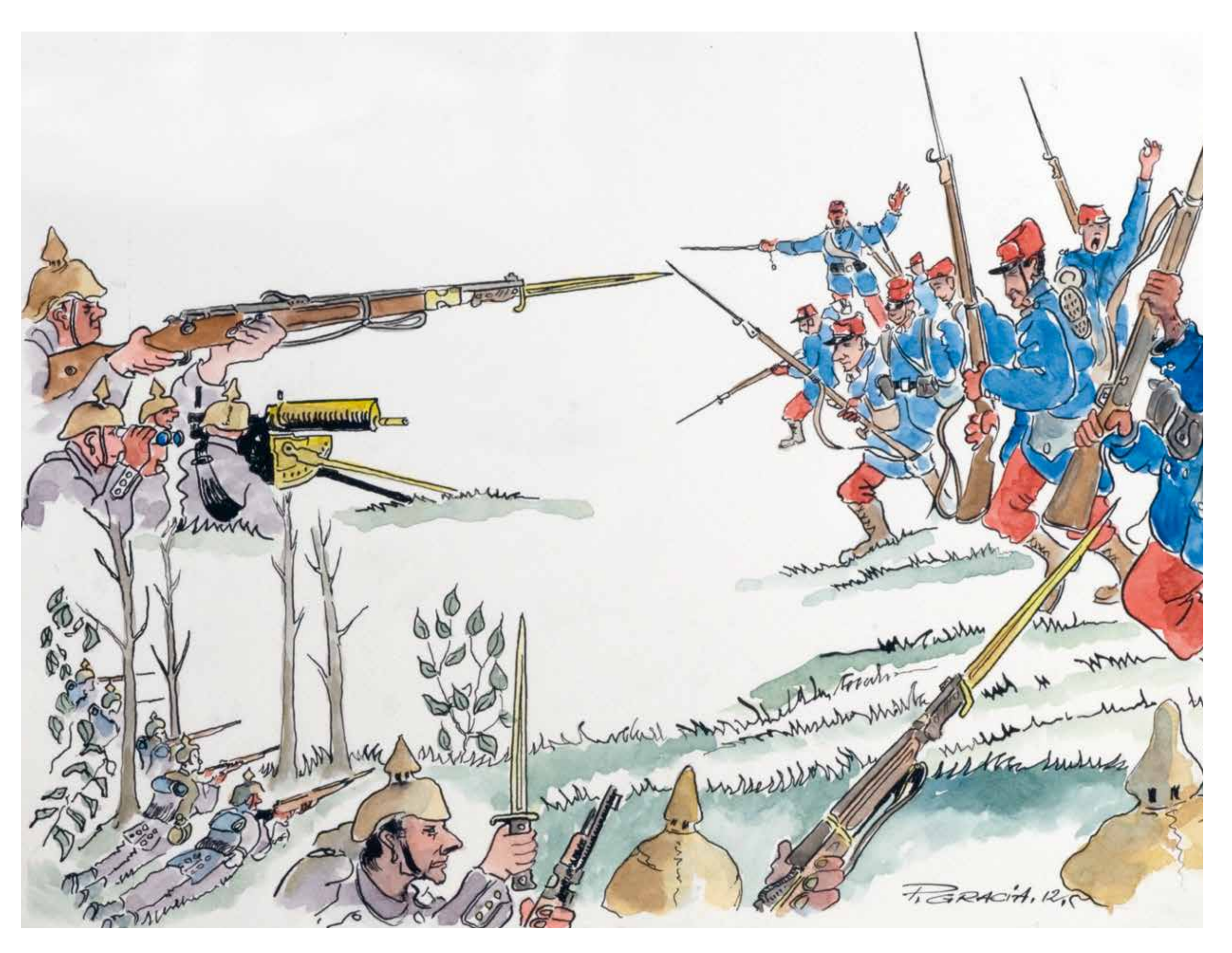
BATAILLE DE BRANDEVILLE – Illustration Patrice GRACIA SCHLACHT VON BRANDEVILLE – Erläuterung Patrice GRACIA

D – Am 27. August 1914 versuchen 2.300 Mann, sich vom Hauptplatz in Montmédy über die Wälder bis nach Verdun durchzuschlagen. Die Garnison biwakiert am 28. August im Wald von Woëvre, an einem unter dem Flurnamen „Fontaine Saint-Dagobert“ bekannten Ort. Am 29. August greift sie den Feind in Brandeville an und ist durch den Überraschungseffekt zunächst im Vorteil. Danach verliert sie jedoch einen Großteil ihrer Männer.