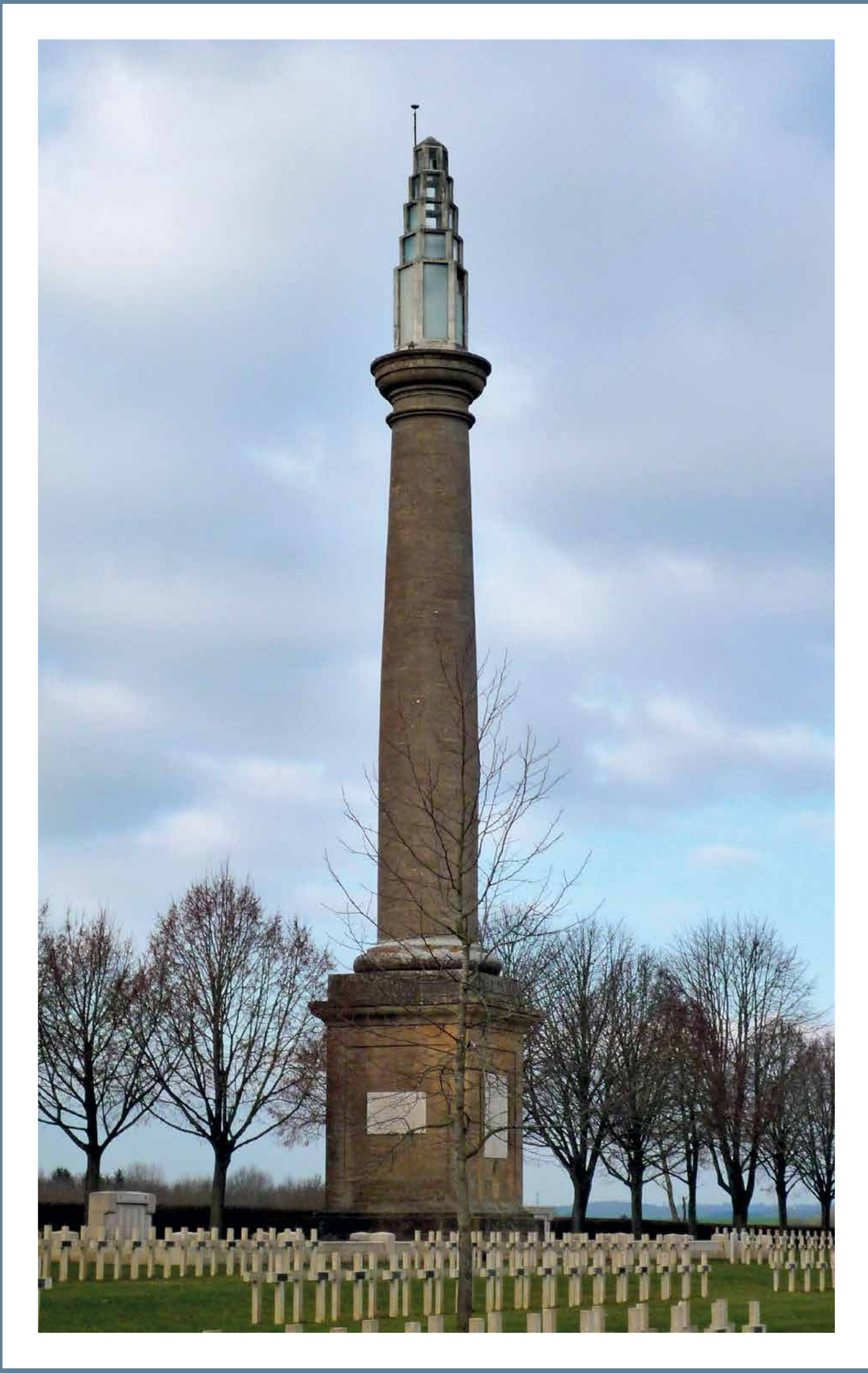
LA LANterne AUX MORTS EIN LEUCHTTURM HALT DIE WACHT

Le village accueille également un cimetière et une nécropole allemande sur la route de Longuyon