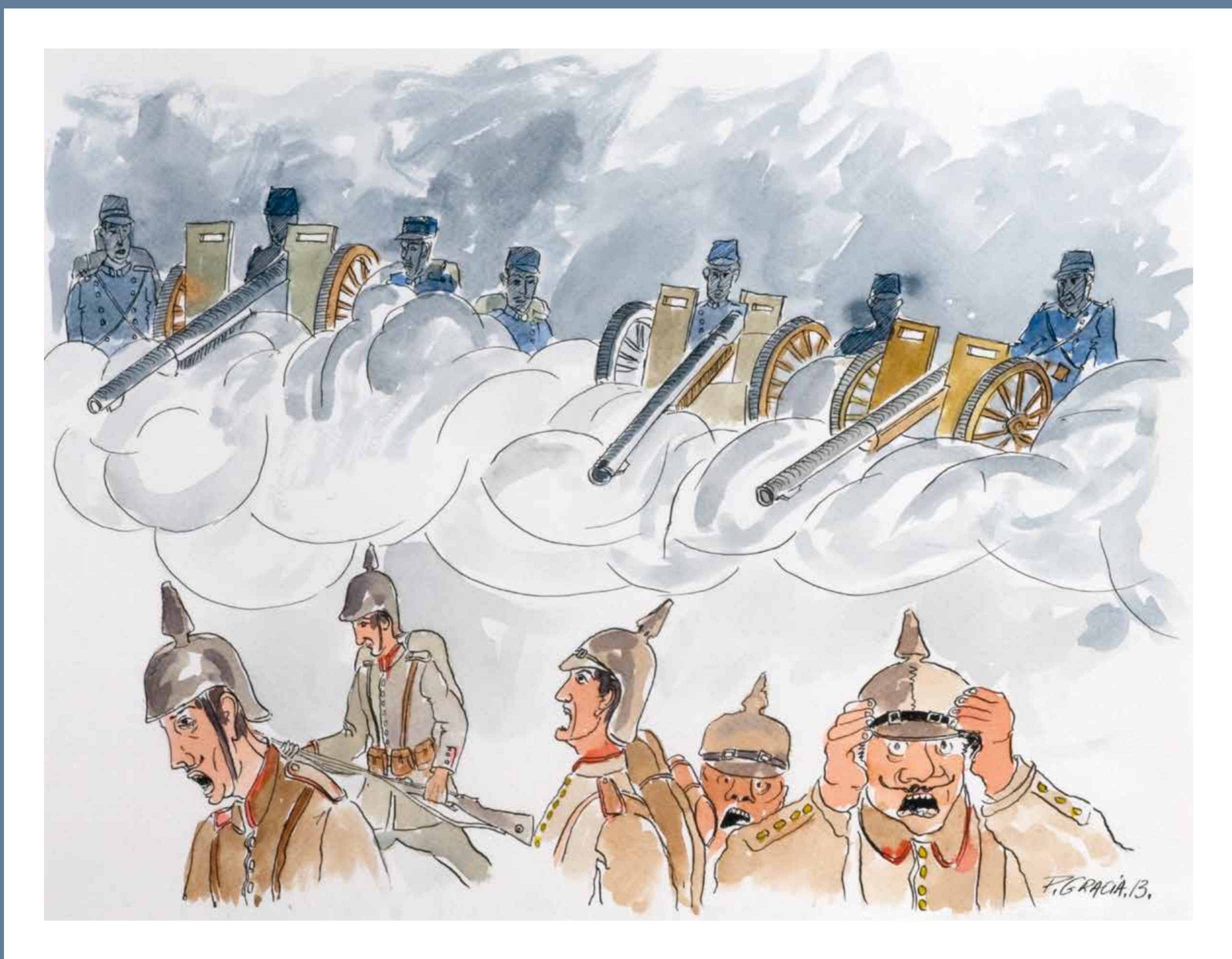
LES DIABLES NOIRS DIE „SCHWARZEN TEUFEL“