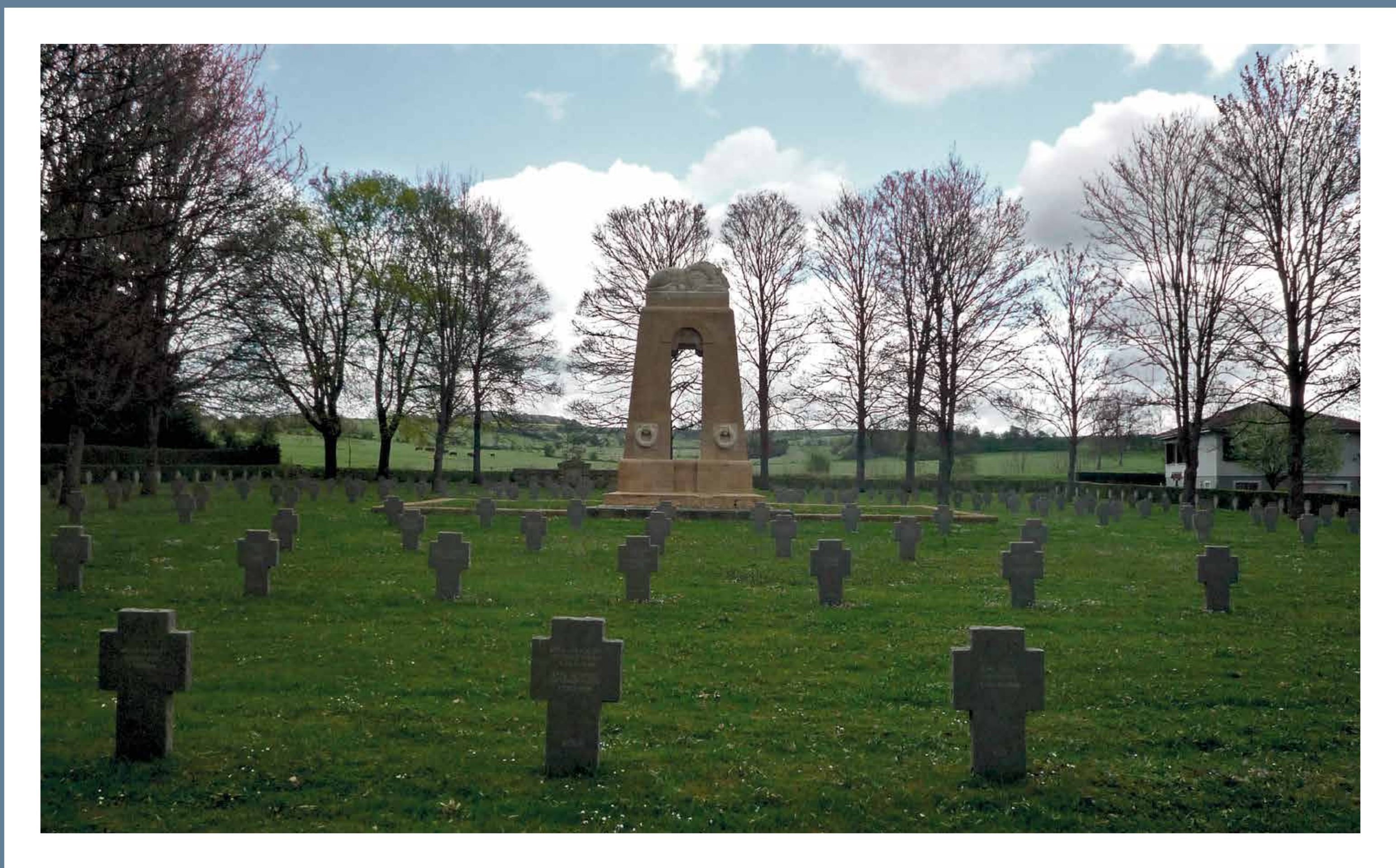
LA NECROPOLE ALLEMANDE DIE DEUTSCHE NEKROPOLE